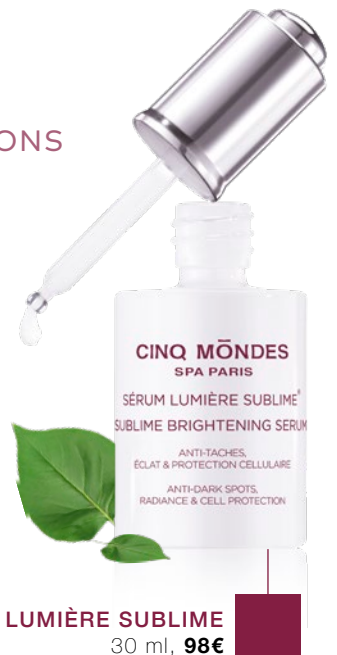
SÉRUMS LUMIÈRE SUBLIME 30 ml, 98€