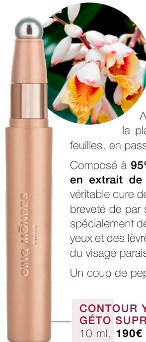
CONTOUR YEUX ET LÈVRES GÊTO SUPRÊME 10 ml, 190€